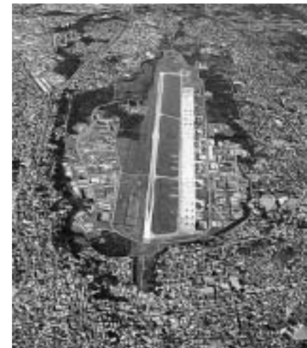
世界で一番キケンな普天間基地

米軍普天間基地の無条件撤去は、もはや日本国民の一致した願いです。今度の参院選挙は、そのことが問われています。移転先探しやたらい回しではなく、米軍海兵隊は直ちに退いてもらうという政策こそ私たちの願いです。憲法九条を守り、軍事費を削って国民生活や教育に回すことが大切です。