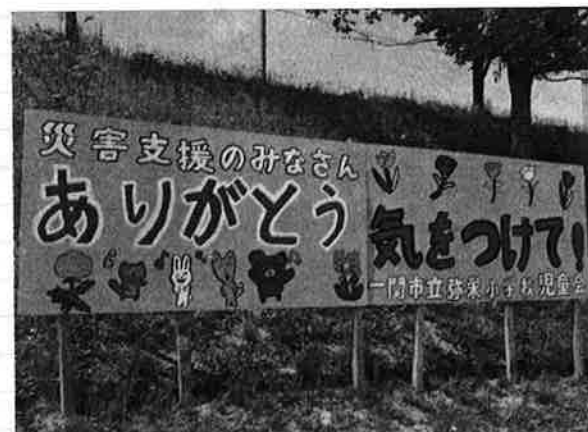
被災地への車中、支援チームは毎回この看板に見送られていました。こちらこそ、ありがとうございます！