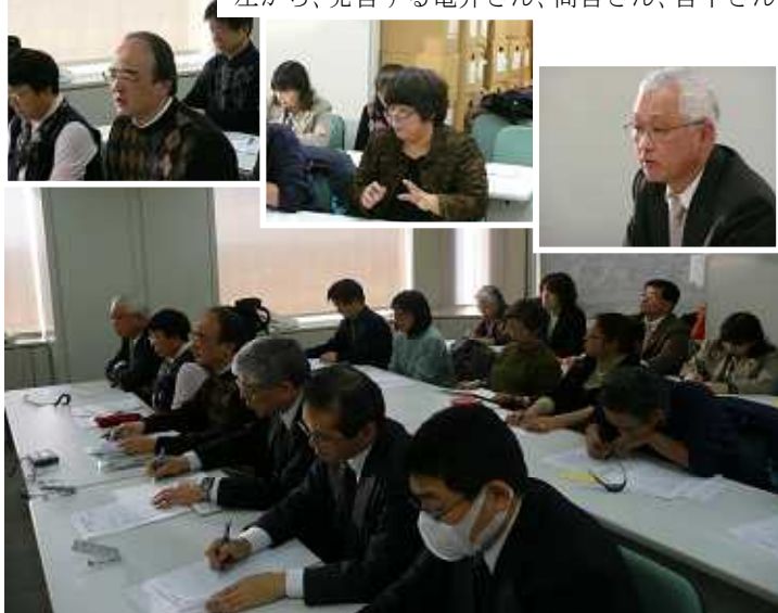
緊急要請に、事務職員・栄養職員が多数かけつける